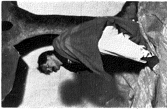
Cura Párroco (Liber Griso: i)